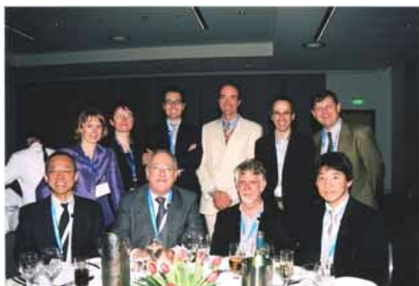
難波助教授（前列左端）、ティング学会事務局長（後列右端）